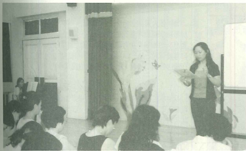
社區與學校資源結合，將提供更多元的學習空間

自上學年本人奉調回家鄉服務，一直秉持學校課程統整化、教材生活化、教學方法活動化、塑造以兒童為主的學習情境，並時時以學校教育走入社區為念，期盼有朝一日學校能成為社區休