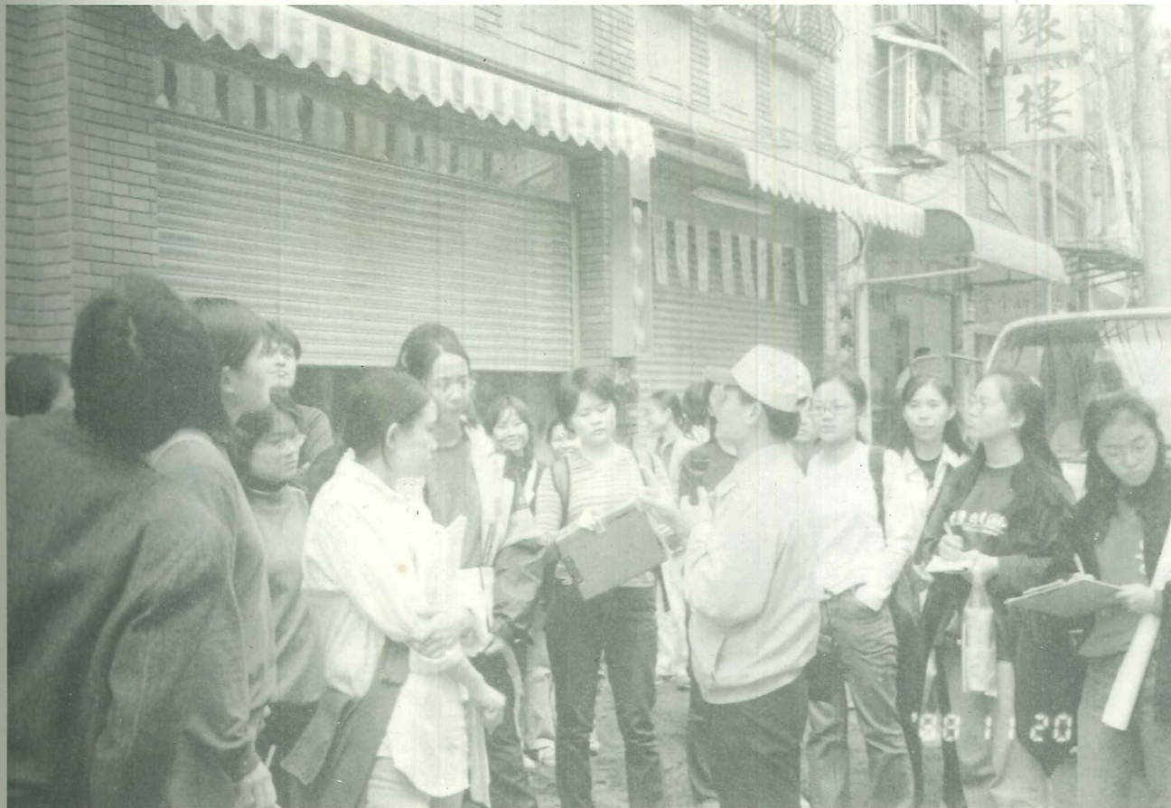
走出校園，認識在地文化，是學生與在地居民雙向互動的開始

其實，淡江大學裡的部份師生早已因為居住關係，而成為新一代的淡水人，關懷自身環境品質，提升社區文化水平，當然是淡水人的共同願景。淡江大學裡高素質、有服務熱忱的人力，將是淡水文化提升的生力軍，淡江為淡水鎮帶來的若只是公園式的進出校園，或提供另一休閒場所，不只是淡水人的自我封閉，也是所有文化人不樂於見到的。我們堅信：若能以開放的心態，摒除政治力與經濟力的干預，淡江大學與淡水鎮將會有互相引以為傲的文化成果。